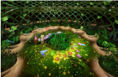
Sentosa Sensoryscape 心之音

新景點！佔地約 3 萬平方公尺，設一條長 350 米、連接名勝世界和海灘的走道；及注入以花園為主題的多感官體驗空間。