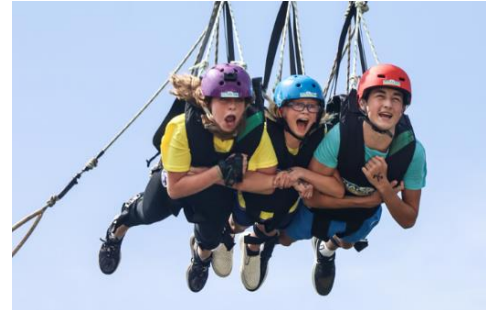
Giant Swing 巨型鞦韆

Once is never enough! 乘坐空中吊椅欣賞聖淘沙天際景色，再駕駛你的小小滑車衝下斜波滑道，共設有 4 條刺激滑道。