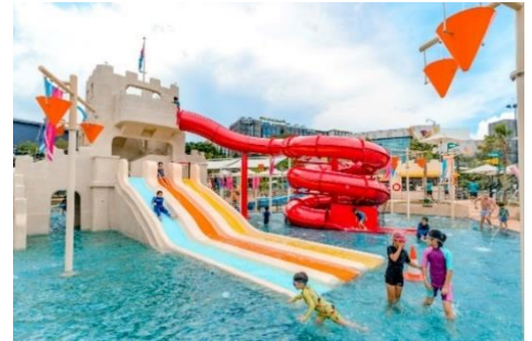
The Palawan @ Sentosa

新景點！結合虛擬遊戲的室內高卡車場，三層樓高設有 14 個彎道，結合燈光和音效，以及虛擬遊戲，猶如置身於電玩世界！