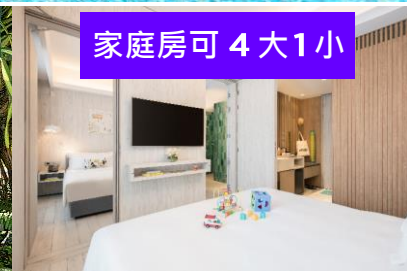
家庭房可 4 大 1 小