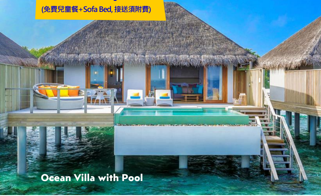
Ocean Villa with Pool