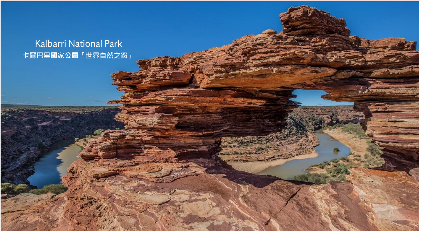
Kalbarri National Park 卡爾巴里國家公園「世界自然之窗」